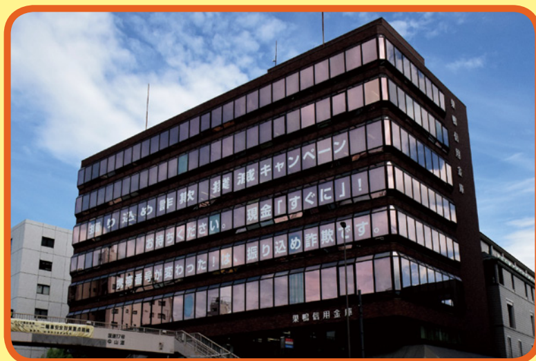
▲本店建物の壁面広告

日々手口が巧妙化している振り込め詐欺犯罪からお客様をお守りし、被害0<ゼロ>を目指してさまざまな取組みを行ってまいります。